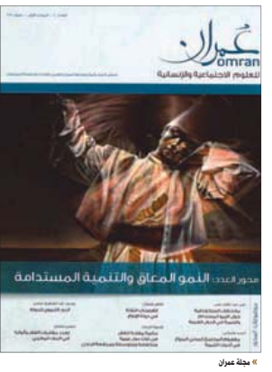
مجلة «عمران» الكلي في جوهره ومضامينه الأساسية، وانشقاق المفاهيم الخظرية والإنسانية بوصفها علوم