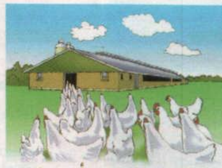
مسكن جميل من «أجروماكس» Home sweet home www.agromax.nl