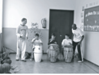
جلسة تبادل ثقافي

فابتكرت كل مدرسة أنشطتها المبنية على دليل حقوق الأطفال وميثاق الأرض. ثم تم تشجيع كل معلم على تطوير رؤيته الخاصة. وتعلم الأطفال في سن الثالثة الميثاق من خلال رسومات توضيحية بسيطة تبين الأرض كمنزلنا المشترك. أما الأطفال الأكبر سنًا، فقد اقترحوا أنشطة تتفاوت ما بين ورش عمل لتبادل الثقافات ومشروع صور مبنية على ميثاق الأرض.