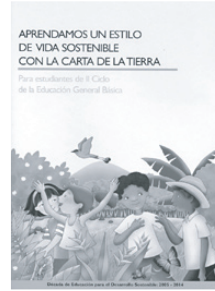
غلاف "دليل المعلمين" المطور في كوستاريكا

أعمل في مجال التعليم. كما أنني أبحث باستمرار عن طرق لتحفيز طلبتي ليصبحوا أكثر وعياً بالعالم من حولهم وأكثر فهماً بأن لهم دوراً يقومون به في المستقبل. وميثاق الأرض أداة قيمة جداً تساعد الناس ليروا أننا جميعاً جزء من صورة أكبر وأنها بحاجة للعمل معاً.