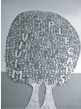
لوحة الكولاج "شجرة الحياة" من عمل طالبة مالوركا، إسبانيا

يمكن للمبدأ المذكور أعلاه أن يكون نقطة البداية لأنشطة في أي موضوع (وهذا أيضاً صحيح بالنسبة للمبادئ الأخرى). كيف؟