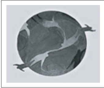
رسم لطالب في حصة الرسم التخطيطي والتوضيحي لدائرة تنمية المجتمع وتطبيق الاقتصاديات في جامعة فيرمونت، أمريكا. التعليق كان لنتوير صورة (صور) تمثل هدف ميثاق الأرض

يمكن لطريقة تنظيمك وإدارتك لصفك أن توفر فرصة ممتازة لتجسيد مبادئ ميثاق الأرض