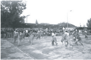
الاحتفال بالرقص الفلوكلوري

وكلما ازداد وعي الطلبة بميثاق الأرض. كلما أصبح من السهل على المعلمين إيجاد روابط بين مبادئ ميثاق الأرض وموضوع الحصة. وساعدت هذه العملية الطلبة تحقيق وتعزيز معرفتهم وقابليتهم وتوجهاتهم وقيمهم اللازمة للعلاقة المسؤولة مع البيئة. وفيما بعد. تبنى كل من المعلمين والطلبة دوراً فعالاً وتشاركياً في العمل نحو إيجاد حلول للمشاكل التي تؤثر على مجتمعهم.