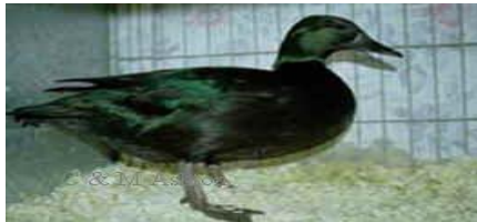
٣- البط الهندي الشرقي الأسود : يعرف اختصاراً بالبط الأسود لونه أسود جميل