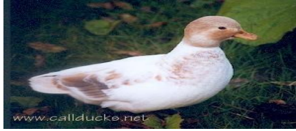
١- بط الكال : بط صغير الحجم لا يتجاوز وزنه ١ كيلو غرام

ثالثاً: البط الخاص بالزينة: وهذه العروق تمتاز بجمال شكلها وحسن منظرها وتلوين ريشها وتشكيل رأسها ورقبتها وليس لها أهمية اقتصادية كبيرة، ولكنها تربي لجمال ريشها وتشمل العروق التالية: