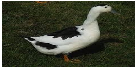
٣- بط ماغبي سلالة انكليزية يتداخل فيه الأبيض والأسود