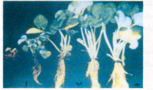
أعراض الذبول في الفراولة