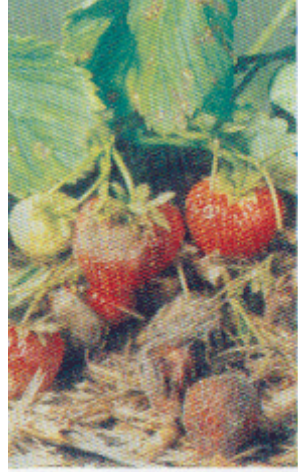
ثمار فراولة مصابة بمرض العفن الرمادى أو عفن البوتريتس