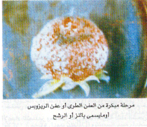
مرحلة مبكرة من العفن الطرى أو عفن الريزوبس أومايسى بالنز أو الرشع