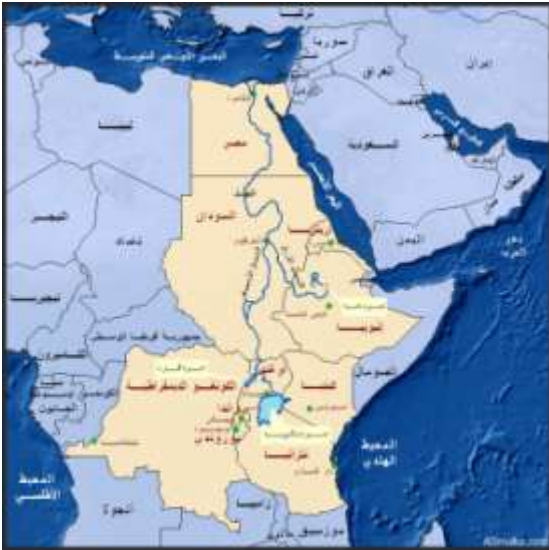
نهر النيل من المنبع إلى المصب

لذا يشهد التعاون العسكري الصهيوني الأثيوبي ذروته من خلال إسناد أثيوبيا للكيان وبصفة عامة مهمة تدريب وتطوير القوات المسلحة الأثيوبية منذ عام 1996.