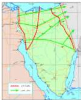
الخطة القتالية المصرية في سيناء (البيانات من عام 1973)

الاستراتيجف عن مصر من ناحية الشرق. وهذه المنطقة التي ببلع عرضها حوالي 58 كيلومترأً تقربفأً تتمركز بها عناصر القوات المسلحة المصرية بقوة لا تزيد على 22 ألف جندي وكذا 230 دبابة و262 مدفعا ميدان ومدفعا مضاد للطائرات و480 مركبة قتال مدرعة.