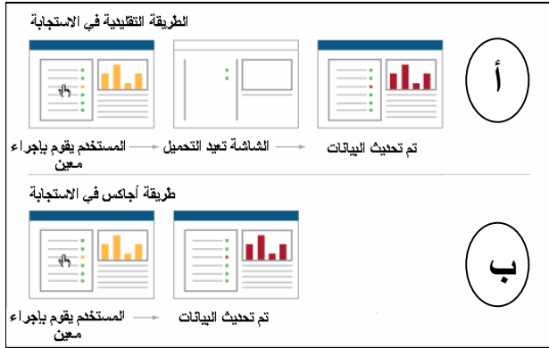
الشكل ٢: الفرق بين الطريقة التقليدية في الاستجابة لطلب المستخدم في المواقع العادية (أ) وطريقة تقنية أجاكس (ب)

يسرّع من تعامل متصفح الإنترنت مع المواقع دون الحاجة لانتظار تحديثها من خادم الويب (باطر، ٢٠٠٦). وكمثال على مواقع تستخدم هذه التقنية تعتبر خرائط قوقل (Google) وبريدها أحد المواقع التي تعتمد على تقنية أجاكس، كما يوضح شكل (٢) فكرة عمل التقنية.