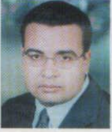
إعداد: م. محمود سلامة الهايشة