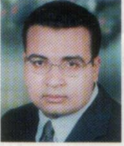
إعداد: م. محمود سلامة الهايشة