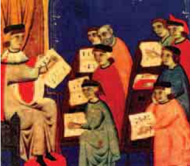
أحد الفصول الدراسية الأولى في جامعة بولونيا. نشأ مقعد الأستاذية في الجامعات منذ ذلك الوقت من القرن الثالث عشر (انظر ص: 62).