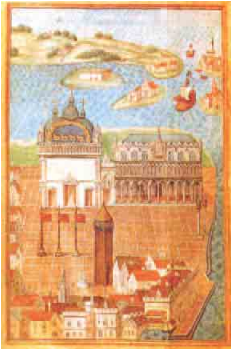
لوحة لمدينة فينيسيا في أواخر القرن الخامس عشر. كانت فينيسيا قوة عظمى في البحر المتوسط، عرفت باسم أعظم الجمهوريات رقيا . (انظر ص: 86).