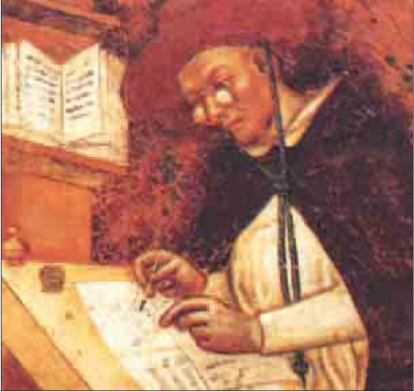
لوحة إيطالية من القرن الرابع عشر (1352) تبين أول صورة معروفة لنظارات القراءة. (انظر ص: 147).