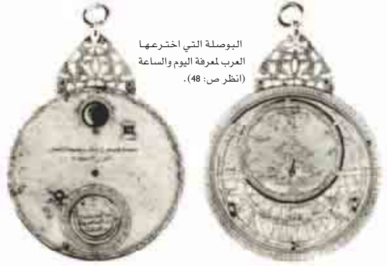
البوصلة التي اخترعها العرب لمعرفة اليوم والساعة. (انظر ص: 48).