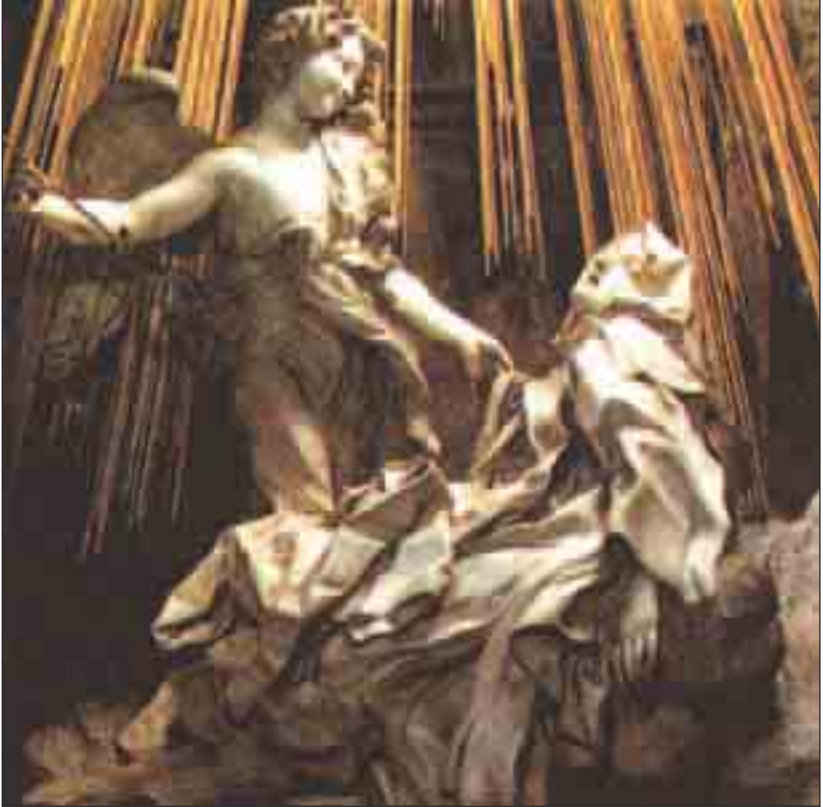
لوحة الفنان بيرنيني Bernini من القرن السابع عشر (1644-1647) تعبر عن ابتهاج القديسة سانت تريزا . (انظر ص: 166) .