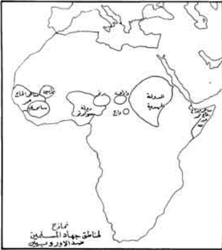
شكل رقم (14)