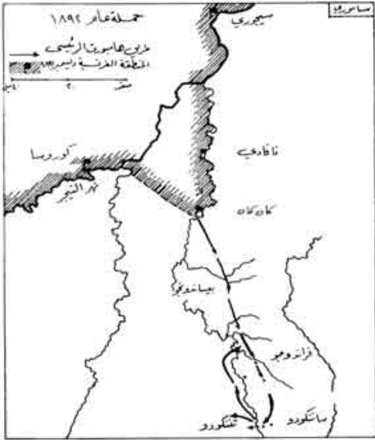
شكل رقم (11)

الذين يكونون له كل عدا، فقرر الابتعاد عن سيطرة الأوروبيين حتى يعيد تشكيل قواته، ويضيف إليها دماء جديدة قادرة على مواجهة هذا الحشد الضخم من الفرنسيين (2).