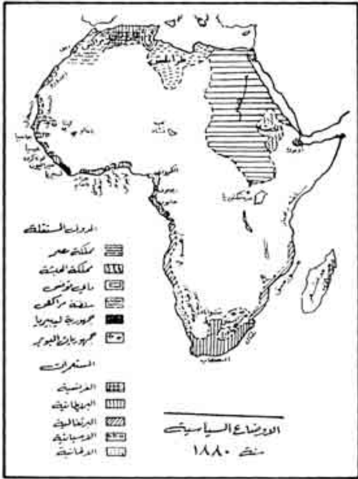
الشكل رقم (1)