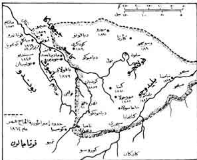
شكل رقم (6)

غزو ماسينا بسبب المجاعة، لكنه عاد وارتفع إلى 30000 جندي عام 1861. وفي عام 1852 أعلن الحاج عمر الجهاد ضد الوثنيين في السودان الغربي، واستطاع في خلال عشر سنوات أن يسيطر على كل السودان الغربي من حدود مدينة تمبكت حتى حدود السنغال الفرنسية، ورغم أنه اعتبر نفسه مصلحاً دينياً، وأعلن الزهد في الأمور الدنيوية المؤقتة إلا أنه كان مستعداً لتحقيق آماله من خلال الطرائق السياسية والعسكرية. واعتبر الحاج عمر أن رسالته المقدسة هي تنقية الإسلام في السودان الغربي من كل ما علق به من شوائب، ووضع حد للوثنية، وتطبيق الشريعة الإسلامية. ومن هنا وضع نفسه على رأس دولة إسلامية. واتبع أسلوب العنف في تحويل الناس الوثنيين إلى الشريعة الإسلامية. وقام ببناء المساجد ونشر المدارس القرآنية في كل أرجاء المنطقة التي امتدت إليهما حركته الإصلاحية. (1)