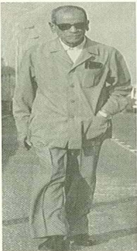
بعد تلقيه خبر فوزه بالجائزة يتمشى في شوارع القاهرة