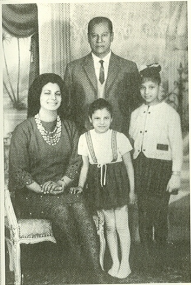
نجيب محفوظ مع أسرته .. زوجته السيدة ، عطية الله ، وابنتيه ، فاطمة ، و أم كلثوم ،