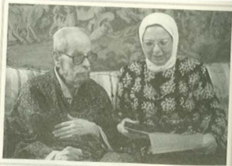
أحدث صورة لتجيب محفوظ مع المؤلفة أكتوبر ٢٠٠١