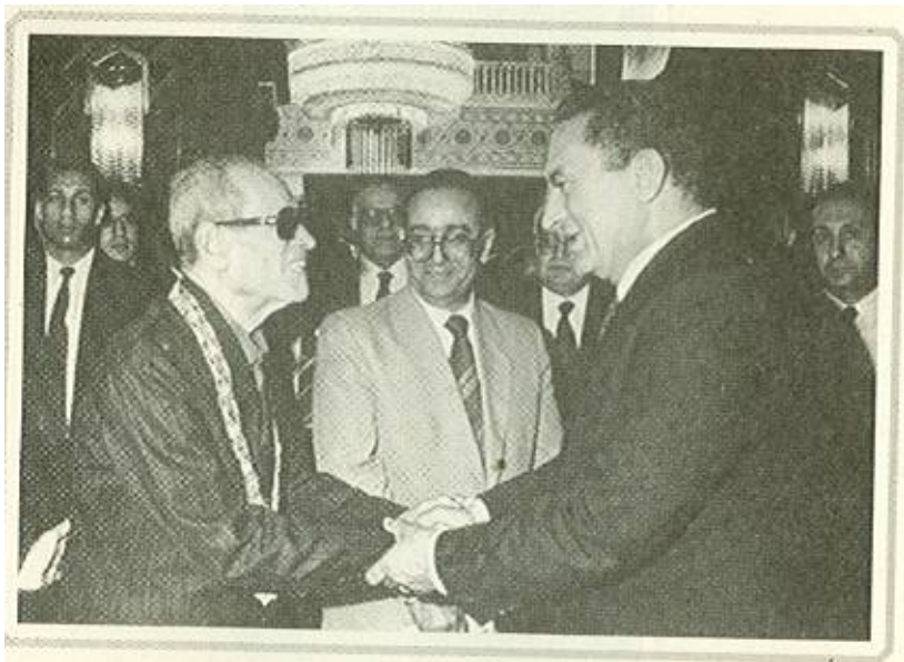
الرئيس مبارك يهنئ الكاتب نجيب محفوظ بعد أن قلده أعلى وسام مصرى (قلادة النيل)