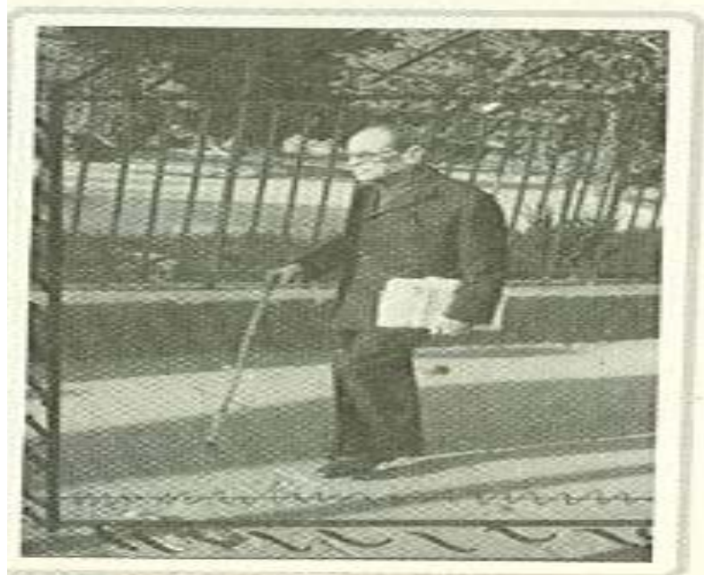
تجيب محفوظ والصحف اليومية .. في طريقه إلى مقهى ، على بابا، حيث يقرأ