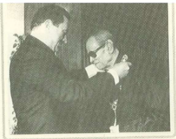
الرئيس مبارك يخلد كاتب مصر الكبير قلادة النيل بعد إعلان نياً حصوله على جائزة نوبل في الأدب