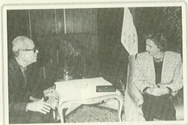
سيدة مصر الأولى تقدم التهنئة لكاتب مصر الأول بعد حصوله على (نوبل)