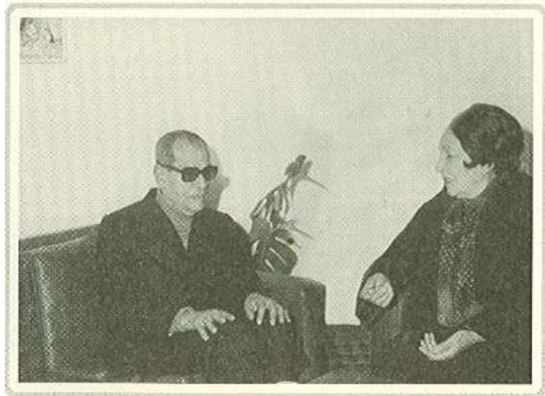
مع الفنانة أمينة رزق... بطلّة «بداية ونهاية» على المسرح وفي السينما