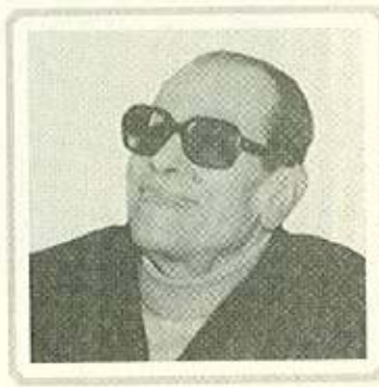
نجيب محفوظ .. نفاؤل وابتسامة دائمة