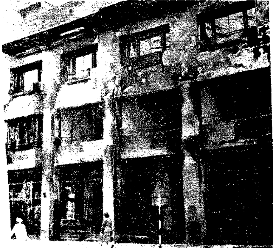
آثار حوادث تخريب القاهرة يوم ٢٦ يناير ١٩٥٢ .