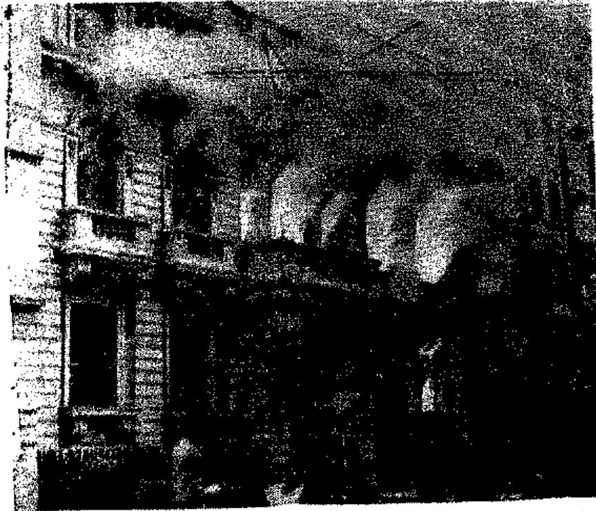
هكذا بدأ بنك «باركليز» وقد اندلعت النيران من شرفاته ونوافذه وتناثرت بعض محتوياته في الشارع والنار تشتعل فيها .