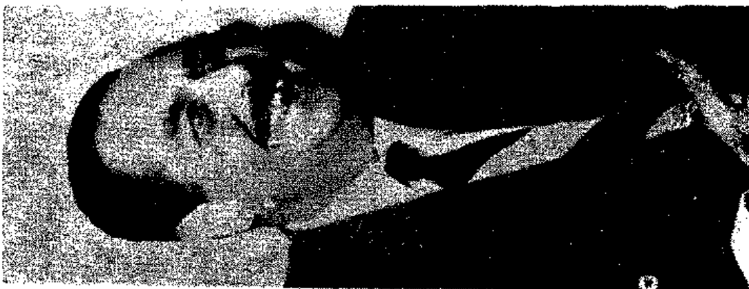
فؤاد سراج الدين باشا