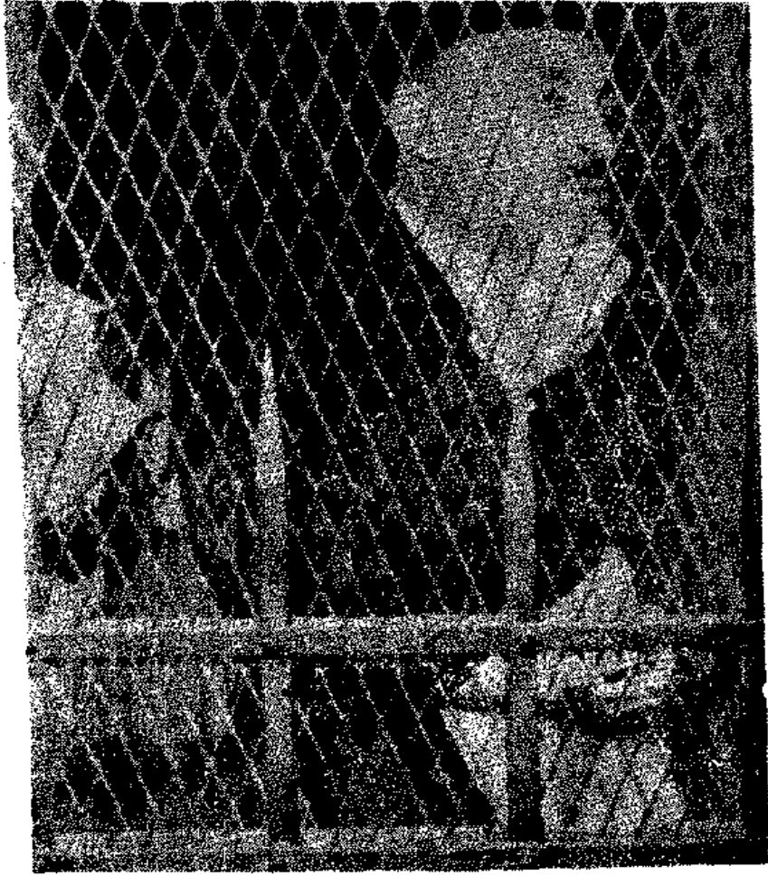
احمد حسين رئيس الحزب الاشتراكي في قفص الاتهام في قضية التحريض على حوادث يوم ٢٦ يناير سنة ١٩٥٢ .