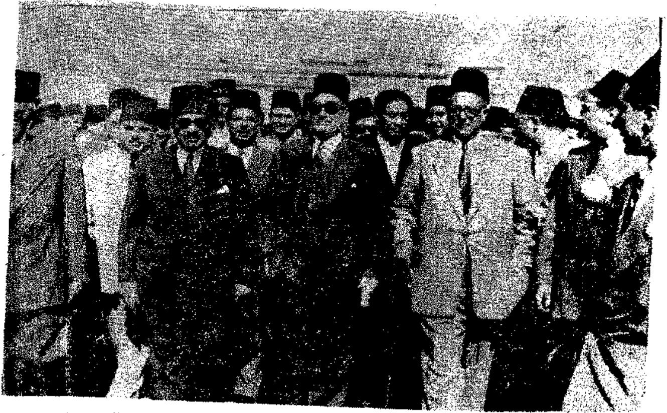
المظاهرة الصامتة بعد إلغاء المعاهسة يوم ١٤ نوفمبر سنة ١٩٥١ مكرم عبيد باشا - مصطفى النحاس باشا - علي ماهر باشا .