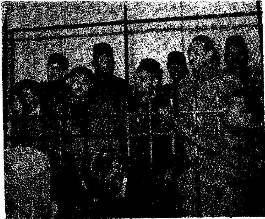
بعض المتهمين في قضية حريق القاهرة .